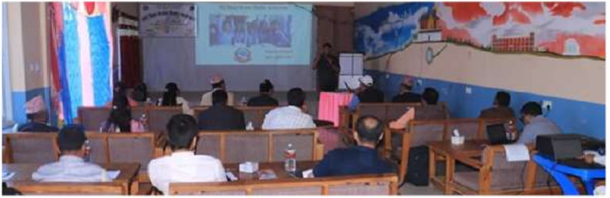
गाउँ शिक्षा योजना निर्माणका लागि सूचना संकलन कार्य